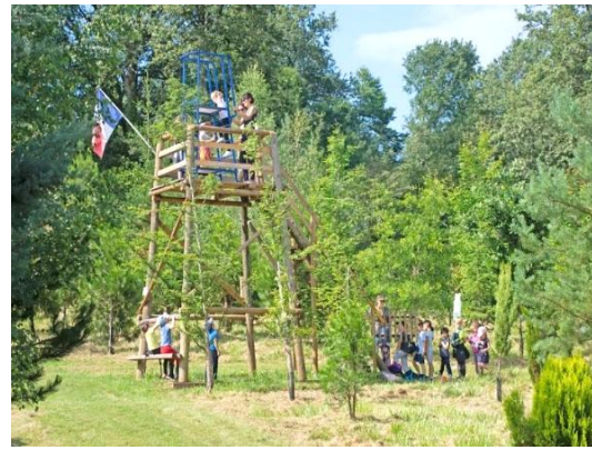
Fig 6. De uitkijktoren is vooral favoriet bij bezoekende schoolklassen

Zo is het arboretum al vrij snel in de regio ‘ontdekt’. Er komen meer en meer bezoekers, inmiddels jaarlijks zo’n 1700. De toegang is gratis en het hek staat altijd open. Er zijn twee wandelingen van ca 45 min uitgezet door het arboretum: één leidt langs bijzondere bomen en de andere leidt langs de kunst. Regelmatig zijn er excursies van schoolklassen. Onze ontvangstruimte wordt ook door mensen uit het dorp gebruikt voor speciale activiteiten zoals repetities van het dorpskoor, repetities van een muziekgroepje, Franse les aan Nederlanders en discussieavonden met film of video.