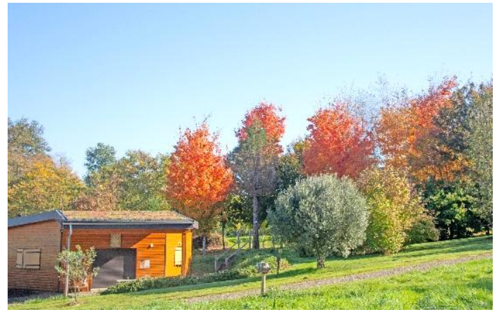
Fig 8 Elke herfst weer is het genieten van de prachtige kleuren