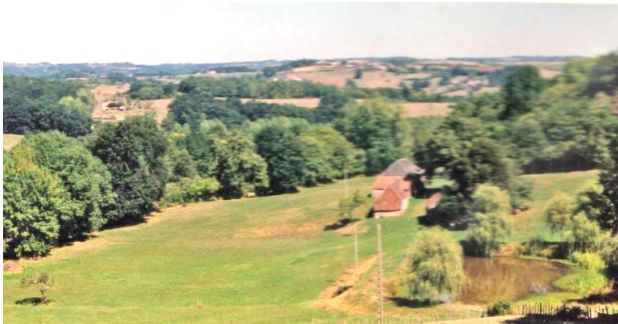
Fig 1. Overzicht deel van het landje in 1990. Rechts de grote vijver, links een solitair appelboompje

We kochten het. In december 1990 planten we de allereerste bomen: een rij Italiaanse populieren. Twintig jaar later (najaar 2011) kopen we 5.5 ha aangrenzend grasland met een bron en een klein stukje bos. Sindsdien omvat het arboretum in totaal 9 ha. Na 35 Jaar is veel wei veranderd in een 'bos'.