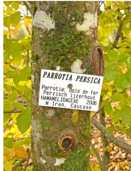
Fig 4. Elke boom is voorzien van een informatief naambordje