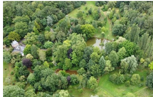
Fig 2. Een deel van het arboretum van boven boven gezien in 2025