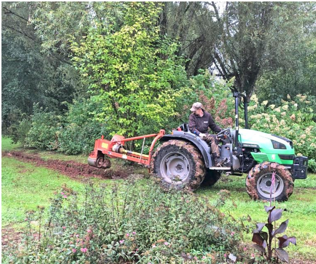
Fig 3. Geulen graven voor de afwatering

Daarom graven we ieder najaar geulen en hebben we in de loop der jaren een aantal vijvers laten graven. Die vullen zich in de winter met regenwater. Met het droger en warmer worden van het klimaat hebben we nu een eigen watervoorraad om jonge aanplant van water te voorzien.